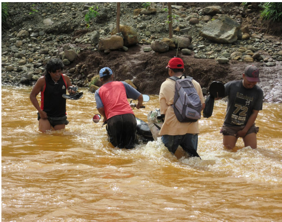
Arbeiter auf dem Weg durch einen mit Nickelrückständen belasteten Fluss

Im Gegensatz zu anderen europäischen Ländern gibt es in Deutschland keine umfangreiche Weiterverarbeitung von Nickel mehr. 13 Einige Unternehmen vertreiben zwar im Ausland gefertigte Produkte aus Nickel, 14 doch sind nur noch wenige deutsche Unternehmen in die Produktion involviert. Laut Gesamtverband der deutschen Buntmetallindustrie gibt es drei Unternehmen, die in der Weiterverarbeitung von Halbzeugen 15 aus Nickel sowie der Herstellung von Nickellegierungen tätig sind: Die Deutsche Nickel GmbH, 16 VDM Metals GmbH 17 sowie die Vacuumschmelze GmbH & Co. KG. 18 Alle drei Unternehmen stellen zwar auf ihren Webseiten umfassende Informationen über ihre Produkte sowie über die Zusammensetzung ihrer Legierungen zur Verfügung, doch finden sich keine Informationen über die Herkunft des Rohstoffs Nickel. Auf den Homepages gibt es allerdings Hinweise auf weitere Standorte der Unternehmen: Die Deutsche Nickel GmbH verfügt neben ihrem Hauptsitz in Schwerte noch über einen Standort in Amerika sowie in China. Die Deutsche Nickel GmbH verfügt auch über eine eigene Schmelze in Deutschland. Die VDM Metals verfügt über mehrere Standorte in Europa, in Aus-