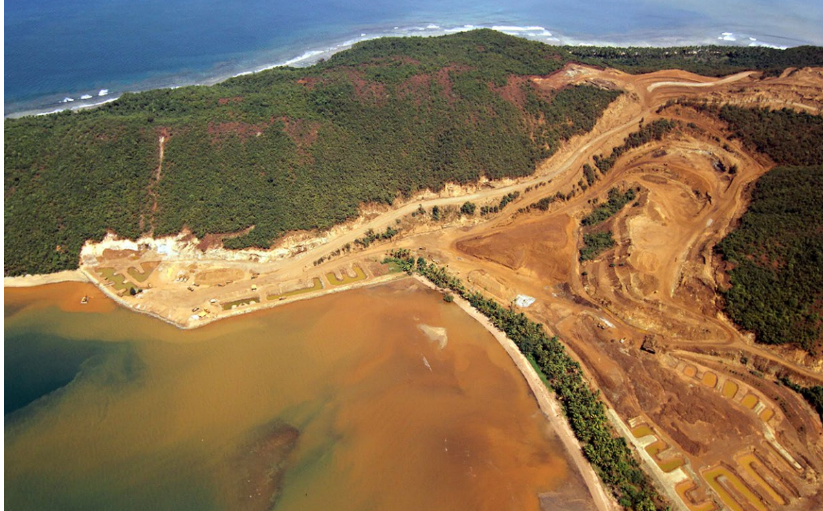
Eine Nickelmine in Surigao del Norte hat gravierende Auswirkungen auf das Land und die umliegenden Gewässer.

Wie beim Abbau der meisten Rohstoffe sind es wenige, in der Regel global agierende Unternehmen, die Nickel weltweit fördern. Zu den beiden wichtigsten Konzernen weltweit gehören der brasilianische Konzern Vale und der russische Konzern Norilsk Nickel, die seit vielen Jahren in unterschiedlicher Reihenfolge die Spitzenposition besetzen. Vale baut Nickel in Kanada, Brasilien, Indonesien, Taiwan und Neukaledonien ab. In den Philippinen hat Vale seit 2008 in Forschung und Explorationen zum Abbau von Kupfer investiert. Das Unternehmen baut zwar keine Rohstoffe im Land ab, hat aber zwei Floating Transfer Stations in Subic Bay, um über die Philippinen den chinesischen Markt zu versorgen. 1 Norilsk Nickel ist in Russland, Finnland, Botswana, Südafrika und Australien aktiv.