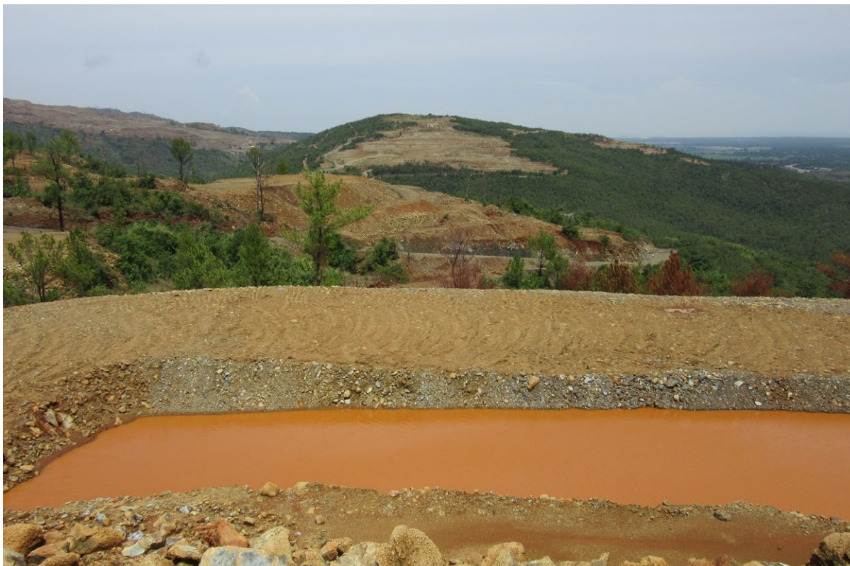
Neues Nickel-Absatzbecken, nachdem das alte einem Hangrutsch zum Opfer fiel

Die Bundesregierung sollte sich für bindende Abfallvermeidungsziele einsetzen. Über das Produktdesign (bei Elektronik-Hardware und Software) muss die Wiederverwendung, Repa-